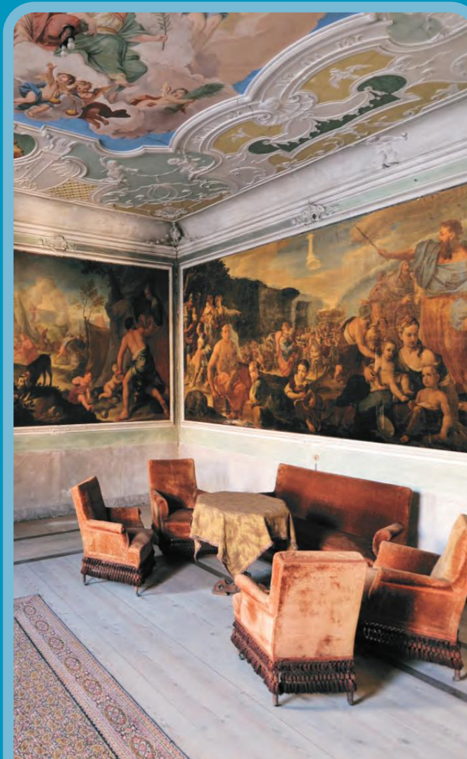
Interno Palazzo Betta Grillo

Si ringrazia per la collaborazione FONDAZIONE CARITRO CASA DI PROPRIETÀ DI TRENTO E ROVERETO